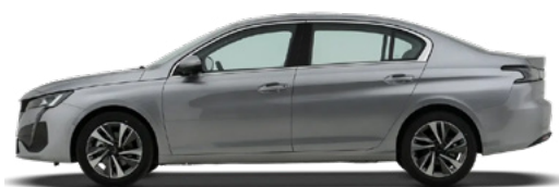
Серый "Silver Grey" (MOF4)