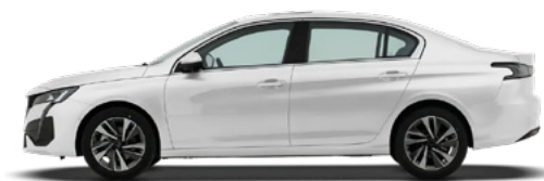
Белый "Okenite White" (MOSU)