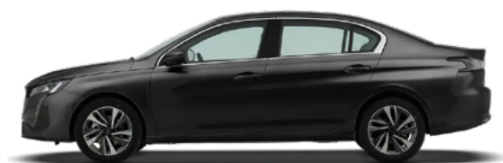
Черный "Black" (MO9V)