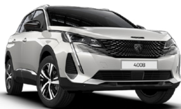
Белый перламутр "Blanc Nacre" (M6N9)