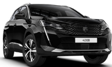
Серый "Gris Platinum" (M0VL)