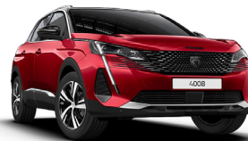
Красный ROUGE ELIXIR