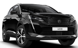
Черный NOIR PERLA NERA