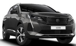
Серый GRIS PLATINUM