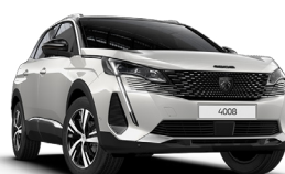
Белый перламутр BLANC NACRÉ