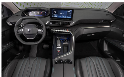
Кожа CLAUDIA / 8YFQ