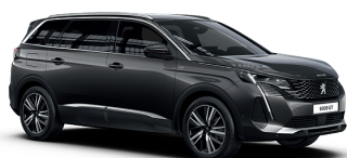
Серый GRIS PLATINUM