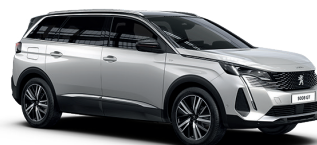
Белый перламутр BLANC NACRÉ