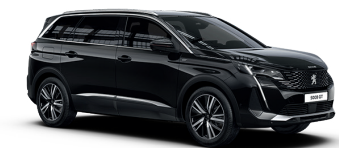
Черный NOIR PERLA NERA