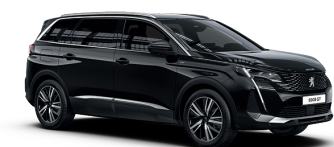
Черный NOIR PERLA NERA