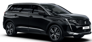
Черный NOIR PERLA NERA