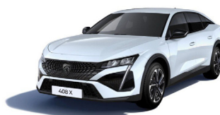
Белый перламутр BLANC NACRÉ