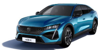
Изумрудно-синий металлик OBSESSION BLUE