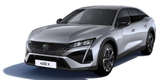
Серый металлик ARTENSE GREY