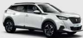
Белый Blanc Vanquise

белый Blanc Vanquise и оранжевый Orange Fusion.