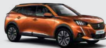
Оранжевый металлик Orange Fusion