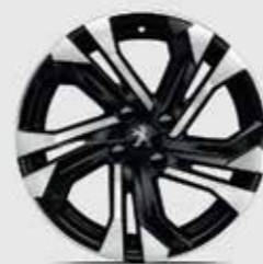
17" SALAMANCA Двухцветные легкосплавные диски

17-дюймовые колесные легкосплавные диски дополняют динамичный дизайн Peugeot 2008.